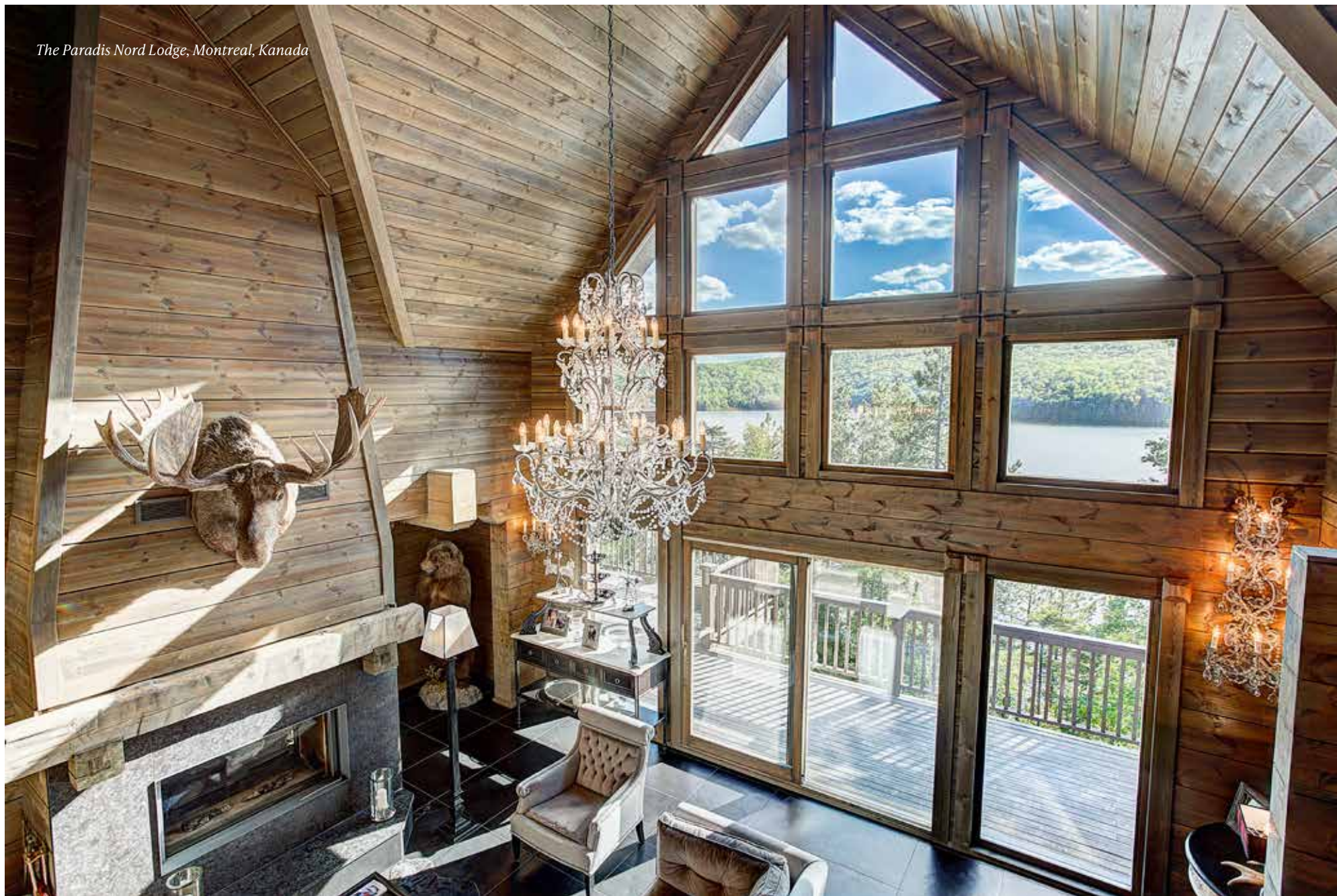
The Paradis Nord Lodge, Montreal, Kanada