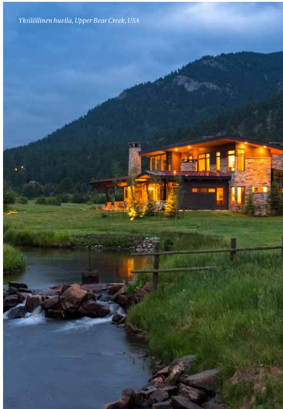
Yksilöllinen huvila, Upper Bear Creek, USA