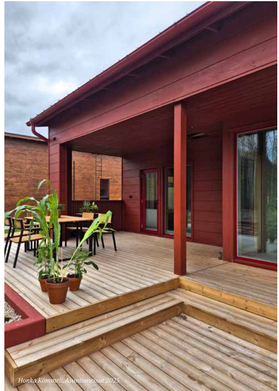
Honka Kömmeli, Asuntomessut 2025

Katsausvuoden vähäisen kysynnän, sekä alhaisten tuotanto- ja toimitusmäärien vuoksi emoyhtiö on yhtenä sopeutustoimenpiteenään joutunut lomauttamaan henkilöstöään. Lisäksi loppuvuonna käytiin muutosneuvottelut, jotka johtivat neljän henkilön irtisanomisiin sekä henkilöstön lyhyt- ja pidempiaikaisiin lomautuksiin. Lomautusvaltuutus on voimassa yhtiön taloudellisen tai tuotannollisen tilanteen niin vaatiessa vuoden 2026 tai alkuvuoden 2027 aikana. Vertailuvuonna yhtiö sulki