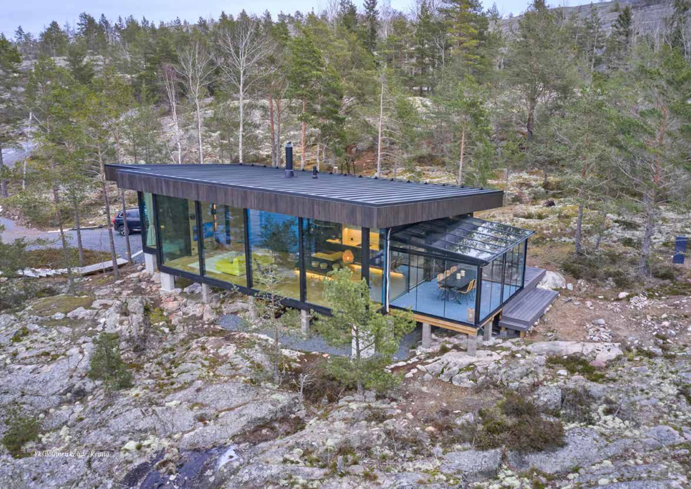
Yksilöllinen kohde, Kemijoki