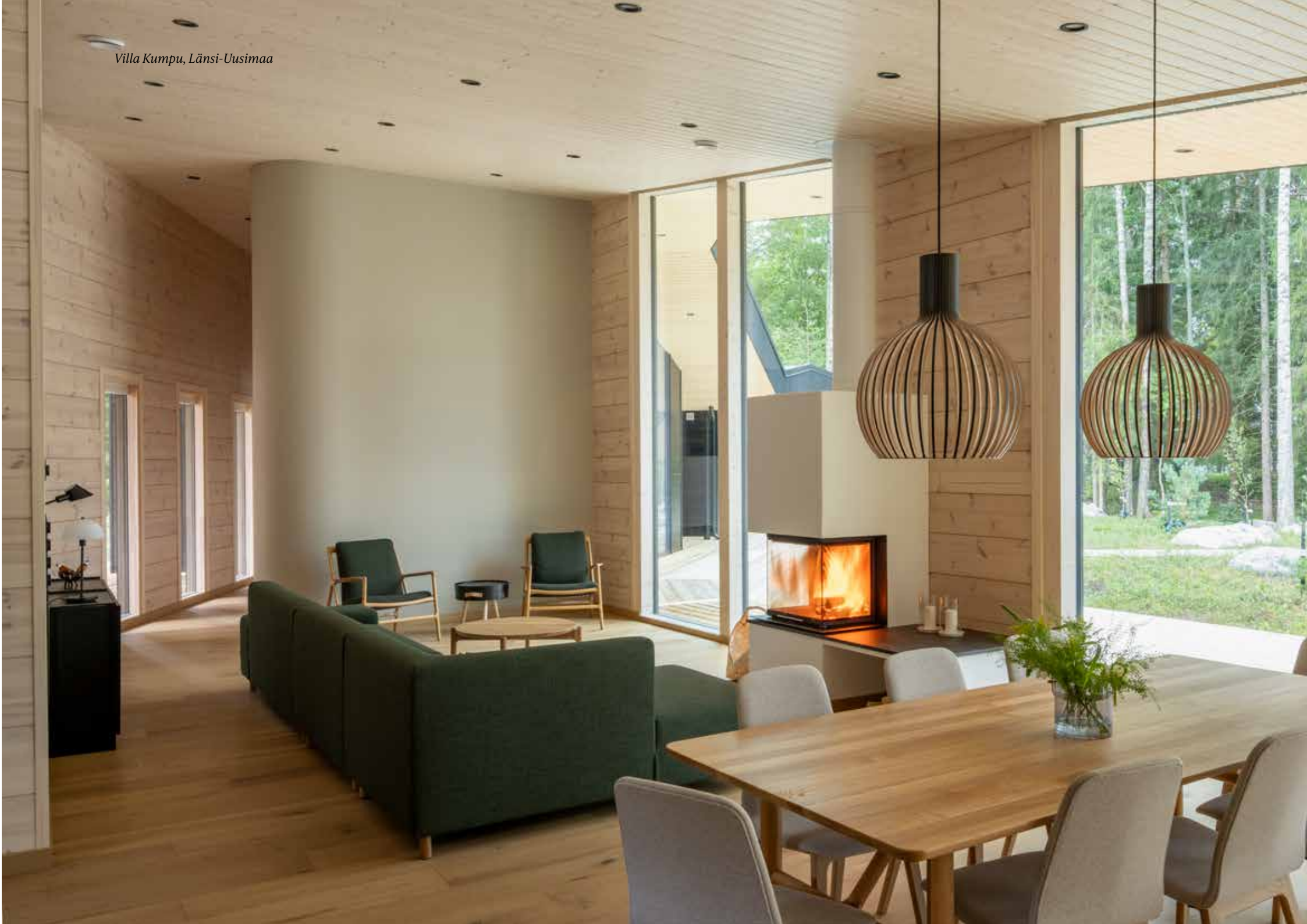
Villa Kumpu, Länsi-Uusimaa